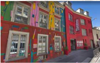
PARIS - THEATRE DE MENILMONTANT - DECEMBRE 2017 CREATION DU SPECTACLE