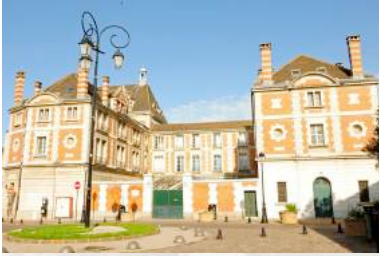
SAINT MAUR DES FOSSES LYCEE TEILHARD DE CHARDIN - JANVIER 2018